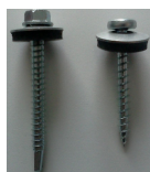
wkręt do drewna i metalu

mocowanie należy wykonać wzdłuż każdej krokwi w odległościach nie większych niż co 50 cm.